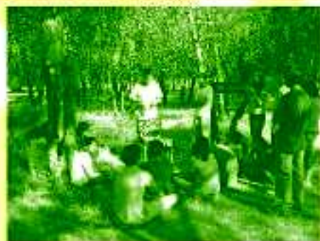
"Los incendios forestales en el medio ambiente", Taller de investigación de causas de los incendios forestales