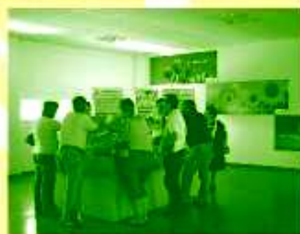
Miembros de la Comisión de Participación Ciudadana de A211, visitan la Planta de Tratamientos de residuos sólidos urbanos